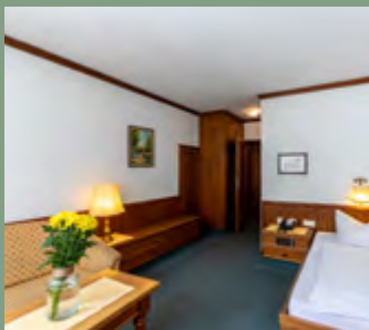
Zimmerbeispiel: Standard ohne Balkon: EZ, ca. 22m 2